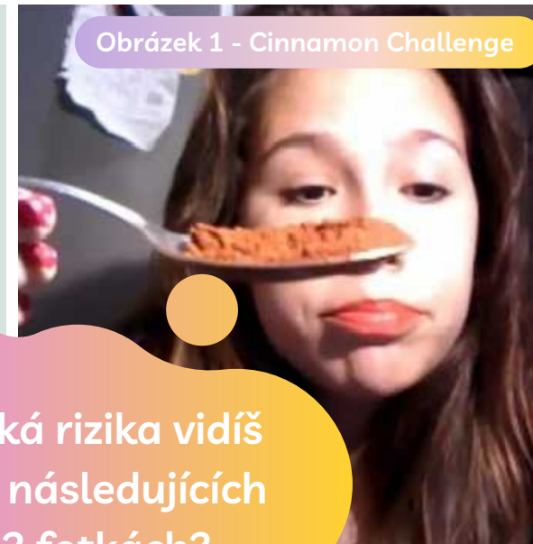
Obrázek 1 - Cinnamon Challenge

Jaká rizika vidíš na následujících 3 fotkách?