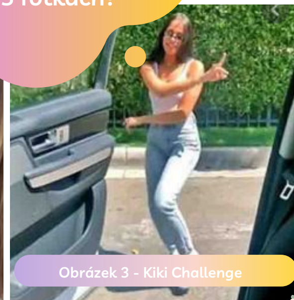
Obrázek 3 - Kiki Challenge